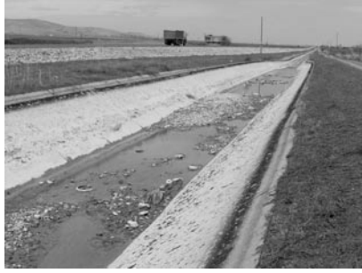
Şekil 19. Urfa ana kanalı içerisindeki taşlar ve kumlar