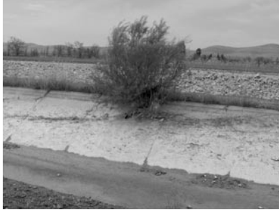
Şekil 7. Urfa ana kanalı beton kaplamasında oluşan bitkiler