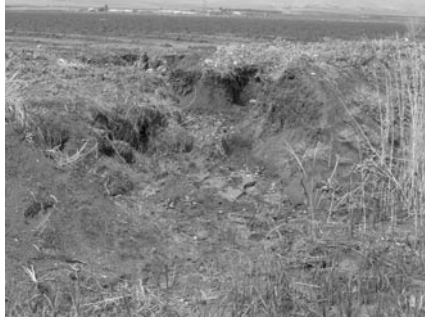
Şekil 23. Urfa drenaj kanalı şev akmaları ve bitki oluşumu