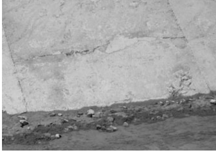
Şekil 6. Urfa ana kanalında ( UY4) çatlamış ve kısmen oturmuş beton kanalı