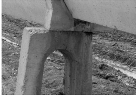
Şekil 16. Kanaletlerde sabit ayaklardaki kayma