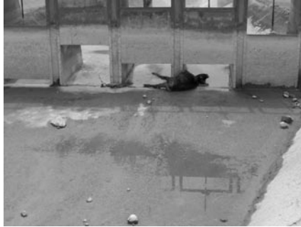
Şekil 21. Urfa ana kanalındaki bir su yapısının kapağına sıkışmış bir hayvan