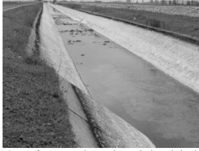
Şekil 18. Urfa ana sulama kanalı içerisinde taşlar