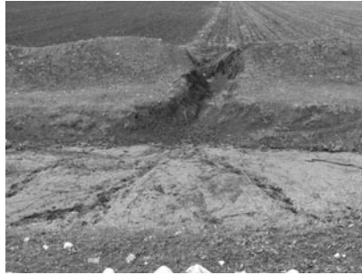
Şekil 4. Urfa ana sulama drenaj kanalı