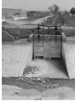
Şekil 12. Sorunlu bir sabit yüklü orifisli priz, Urfa ana kanalı