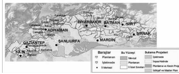
Şekil 2. GAP Su kaynakları projeleri (GAP, 2006)