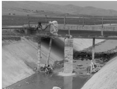
Şekil 17. Urfa ana kanalı üzerinde sistem dışı bir su alma yapısı