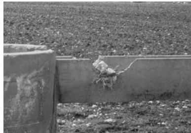
Şekil 13. Urfa sulamalarında kanaletlerin kırılarak su alınması