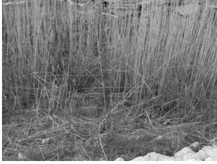
Şekil 22. Urfa drenaj kanalında yetişen bitkiler