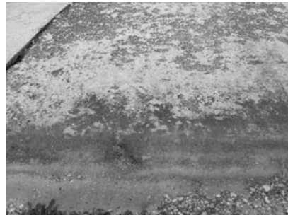
Şekil 9. Urfa ana kanalı; yanmış bir şev beton kaplaması