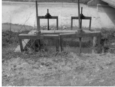
Şekil 11. Sorunlu bir sabit yüklü orifisli priz, Urfa ana kanalı