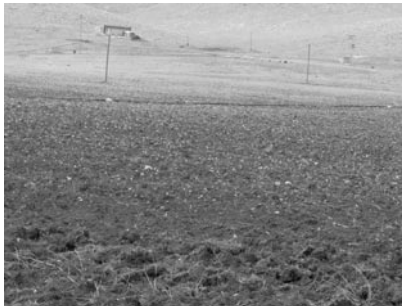
Şekil 5. Eğim aşağı sulama sonucu tarlanın üst taraflarındaki toprak aşınması sonucu taşlık alanların oluşması