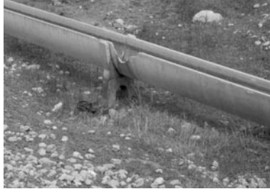
Şekil 14. Kanaletlerin kırılarak su alınması