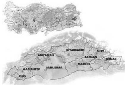
Şekil 1. Türkiye ve GAP Bölgesi (GAP, 2006)