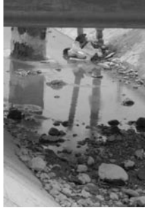
Şekil 20. Urfa ana kanalı içerisindeki taşlar ve diğer malzemeler