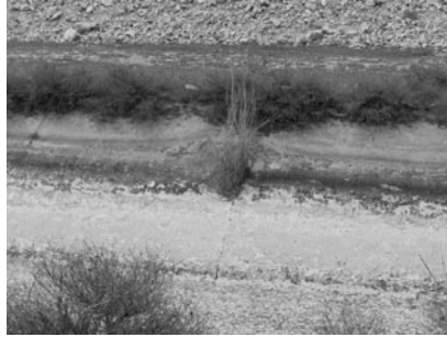
Şekil 8. Urfa ana kanalı şevi, derz aralığında oluşan bitkiler