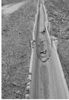
Şekil 15. Kanalet şebekelerinde oturmalara bağlı olarak bozulmalar