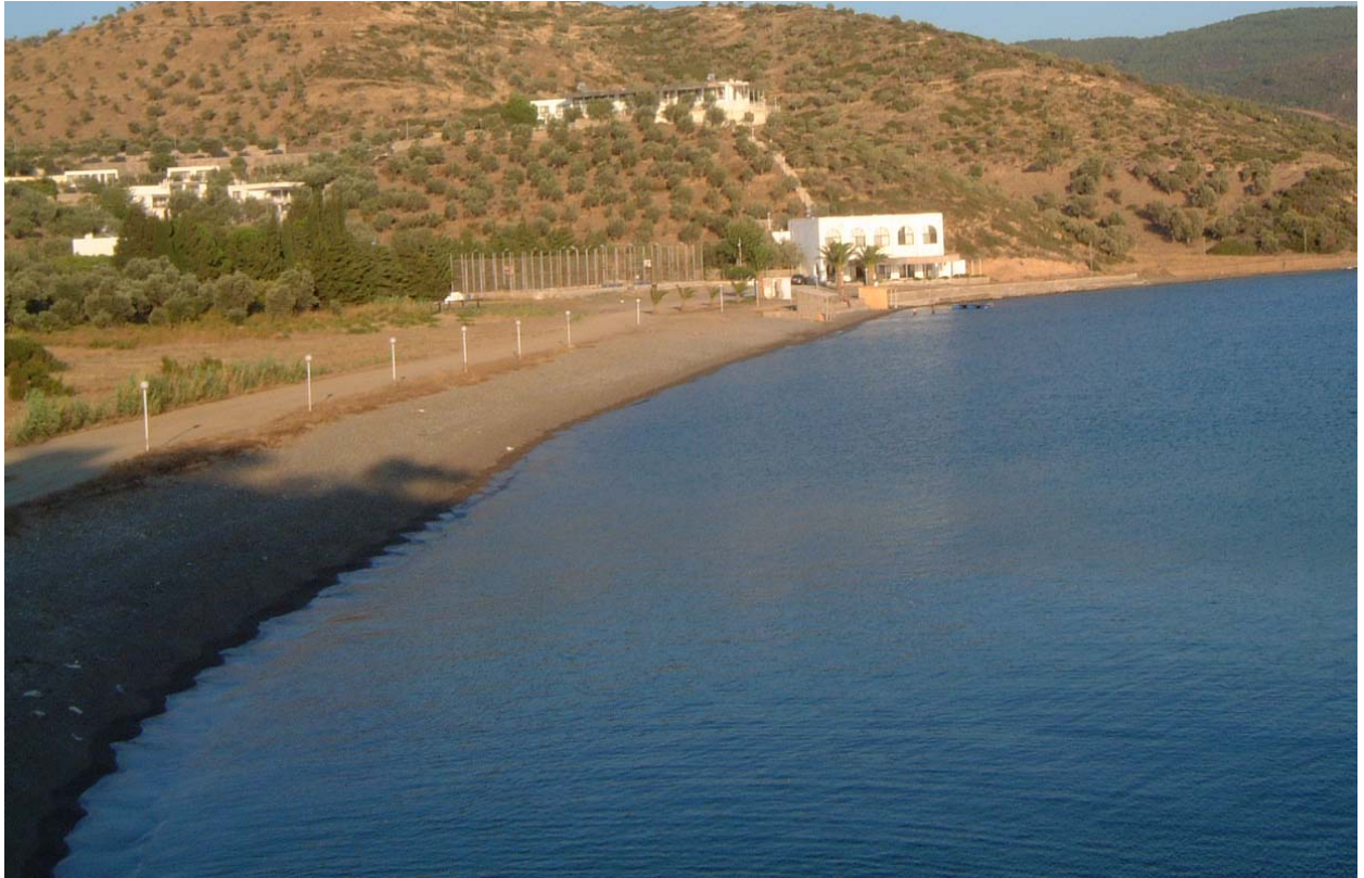
Şekil. 2. Kıyı Tanımlarının Fotografik Gösterimi